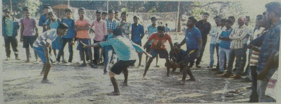
वार्षिक उत्सव... भानपुरी कॉलेज में हो रहे वार्षिक उत्सव में कबड्डी प्रतियोगिता के दौरान प्रतिभा का प्रदर्शन करते विद्यार्थी।